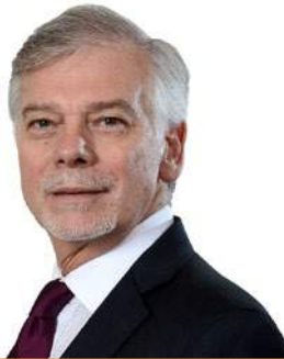
Horacio Carlos Cristiani Presidente