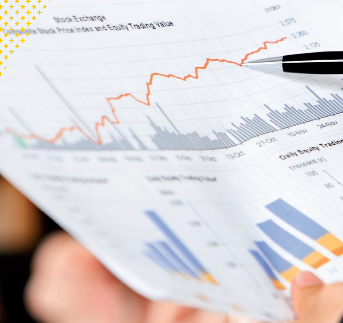
Stock Exchange Daily Stock Price Index and Equity Trading Value

Informe de la Comisión Fiscalizadora Pág. 135